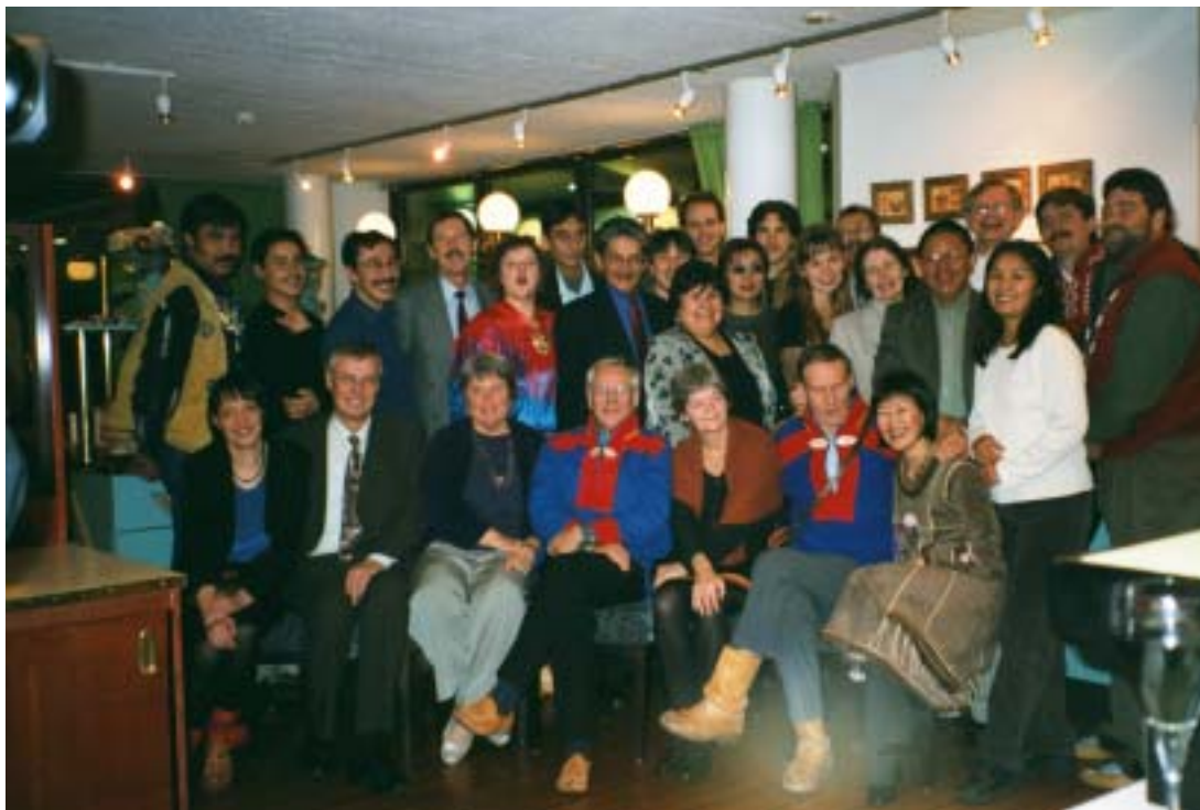
Делегация Постоянных участников на ноябрьском совещании Финляндии.