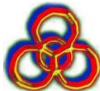
Эмблема Совета Саами