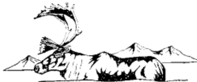
Логотип Вантут Гвичин © "Первые народы Вантут Гвичин"